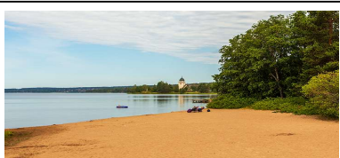
Strandlinje och kyrkan i Rättvik