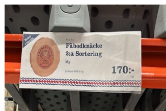
2-a sortering, 5 kg, 170 – 250 kr